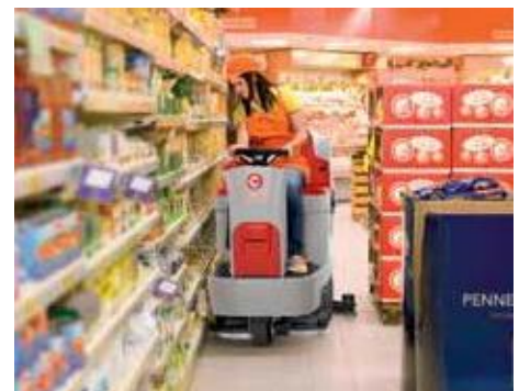
Nem udskiftning af gummi uden brug af værktøj på den eksklusive Comac svaber (Patenteret)