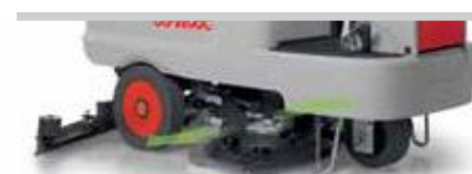
Innova 100 B