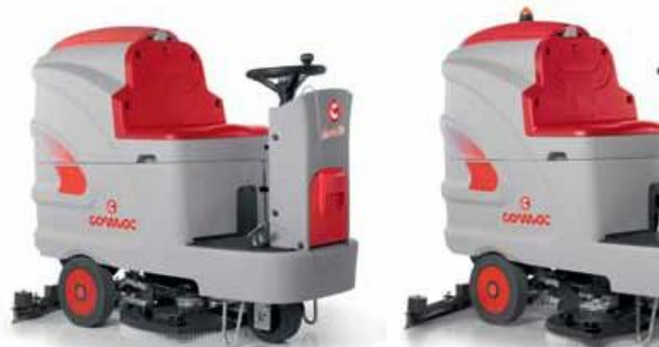
Innova 60 B