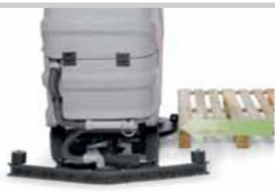
Børstehovedet svinges automatisk på plads, hvis det rammes ved et uheld (Innova 65/75/85/100 B / M).