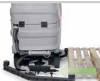
Automatisk svaberfrakobling, hvis den rammes ved et uheld.