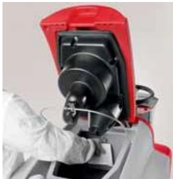
Let og komplet rengøring af beholder

Nem batteriopladning takket være en indbygget batterioplader (skal bestilles)