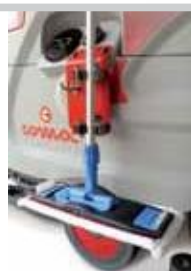
Innova 60/65/75/85/100 B / M - 70 S kan bestilles med udstyr til manuel rengøring, som gør det muligt at supplere rengøringen, hvis man synes, at det er nødvendigt.